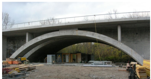
B1, Verbreiterung Brücke über die Vöckla