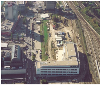
Stadtentwicklungsgebiet Muthgasse (Wien)