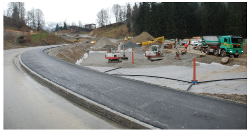
Stadtentwicklung Sonngrub (Kitzbühel)