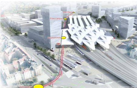
Studie Automated People Mover für den neuen Hauptbahnhof Wien