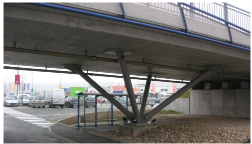
Erschließung Haid Center