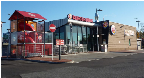
Burger King Laaer Berg, Wien 10.: Verkehrsplanung und ÖBA