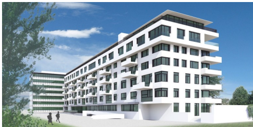
Wohnhaus Jacquingasse 16, Wien 3. statisch-konstruktive und bauphysikalische Bearbeitung