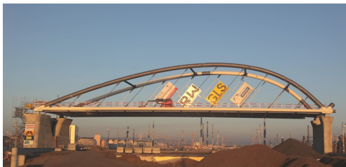
Südbahnhofbrücke, Wien 10.: Gesamtplanung