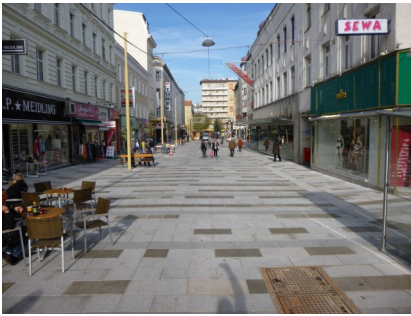
Fußgängerzone Meidlinger Hauptstraße: Straßen- und Verkehrsplanung