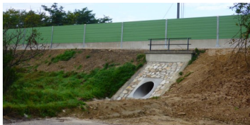
Lärmschutzwand Ulrichskirchen - Schleimbach: Planung, ÖBA