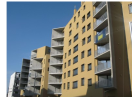
Wien 22., Seestadt Aspern, Baufeld D8 „Slim City“: Tragwerksplanung