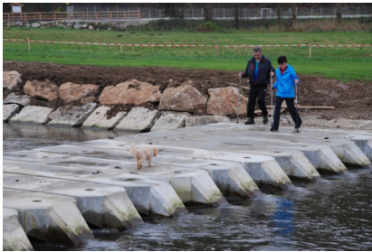
Karlstein Thaya-Furt: Idee, Planung, ÖBA