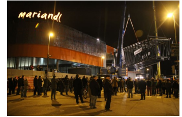
EKZ Mariandl in Kress: Verkehrsplanung