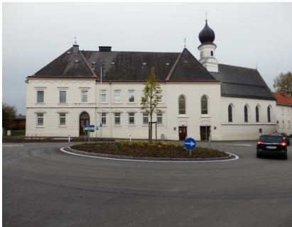
Kreisverkehr St. Anna in Ried i. L.: Straßenplanung, ÖBA