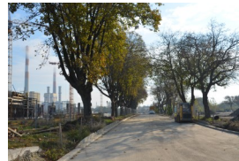
Wien 11., Nussbaumallee: Straßenplanung