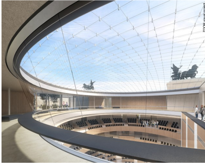
Sanierung Parlament Wien: Generalplanung durch Jabornegg & Pálffy Architekten / AXIS Ingenieurleistungen