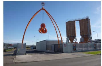
Mist- und Winterdienstplatz Percsostraße: Gesamtplanung, ÖBA