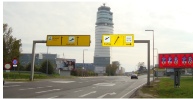
Flughafen Wien: Verkehrszeichenpläne